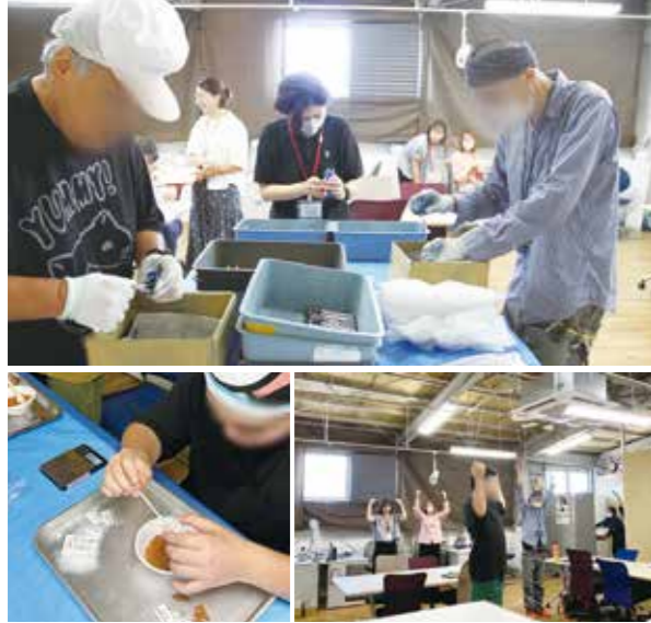
鉛筆削り作業(上)、計量と封入作業(左下)、朝礼の後はみんなで体操(右下)

企業から請け負うリアルな仕事で実践的なトレーニング！ 一人一人に合わせたコーチングにより、自ら考え伝える力を引き出していきます。