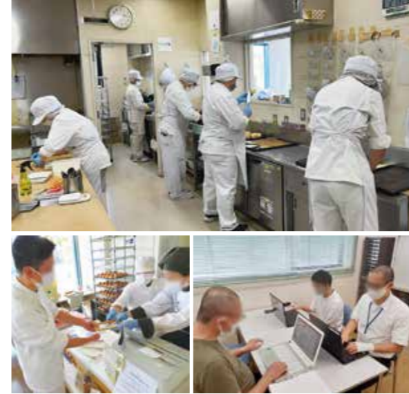
パン製造の様子(上)、販売の様子(左下)、パソコン訓練(右下)

《はたらく よろこびを とともに・・・スワン工舎新座》 新しい自分を目指す方の“人生が変わる瞬間”をサポートします。