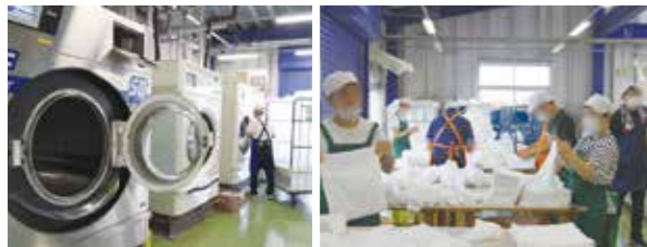
作業場の様子(上)、クリーニングの機械はフル回転(左下)、15,000枚のタオルを手作業で丁寧に畳む(右下)